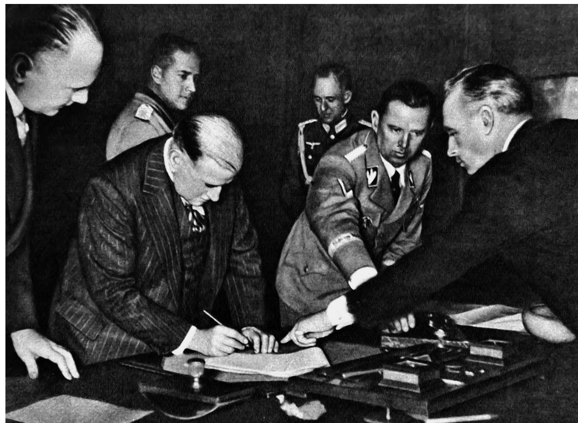
Подписание Мюнхенского соглашения премьер-министром Франции Э. Даладье 30 сентября 1938