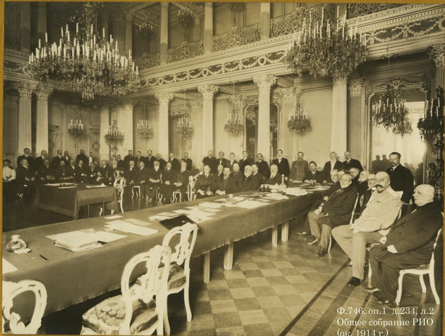
Ф.746, оп.1 д.234, л.2 Общее собрание РИО (ок. 1914 г.)