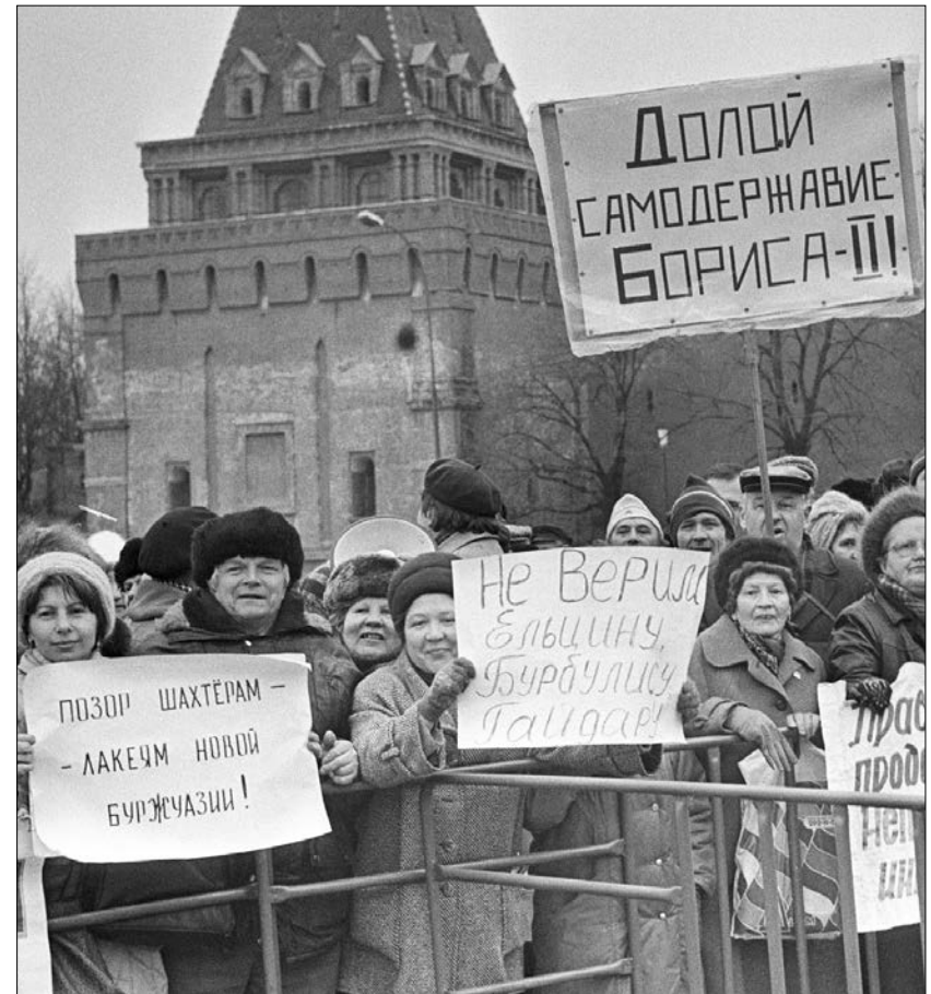
Избиратели: Не верим, Долой, Позор. 1992 год