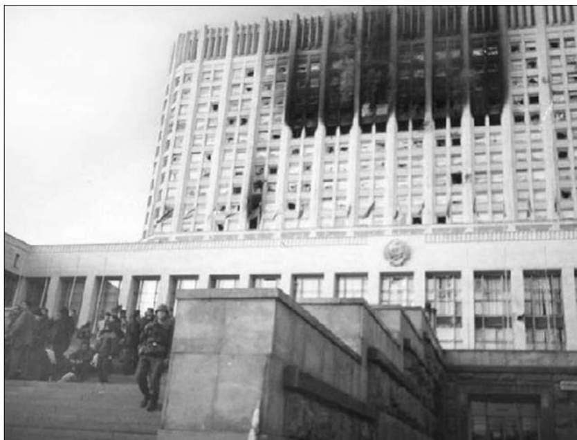
Дом Советов Российской Федерации 4 октября 1993 года.