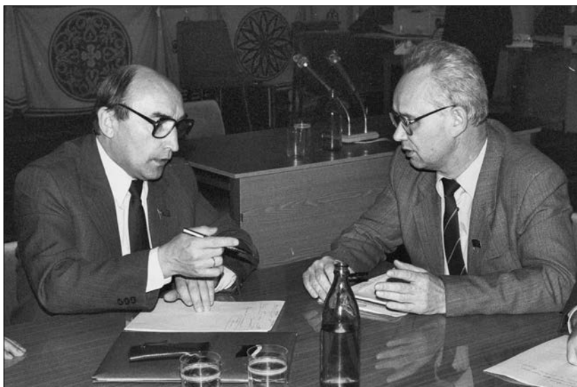
Заместитель Председателя Верховного Совета РФ Ю.Ф. Яров и член Конституционной комиссии, председатель Комитета Верховного Совета РФ по законодательству М.А. Митюков. Ноябрь 1992 года