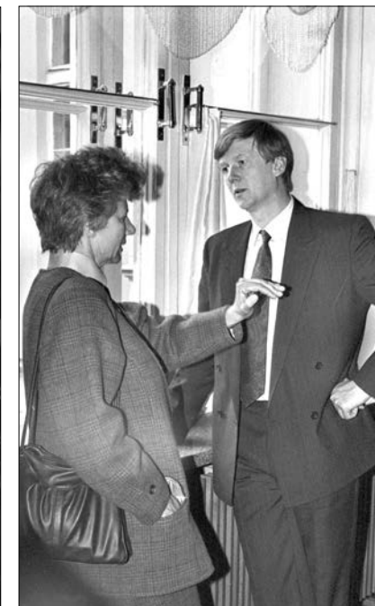
Народный депутат РФ И.А. Вертоградская и Первый заместитель Председателя Правительства РФ А.Б. Чубайс