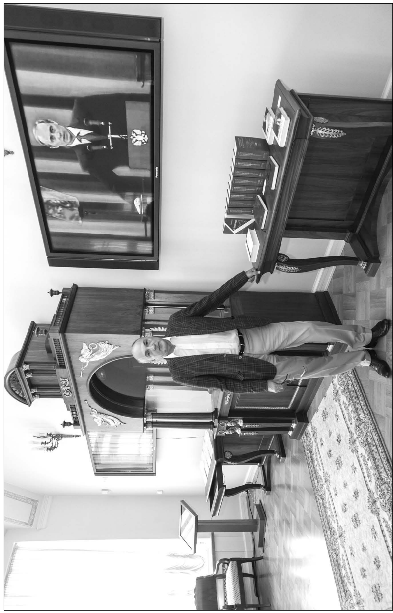
Зал Конституции Президентской библиотеки, Здание Синода, Санкт-Петербург. 16 сентября 2018 года