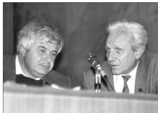
Первый мэр г. Москвы Г.Х. Попов и первый заместитель Председателя Верховного Совета РСФСР, с 1993 по 1996 год — Руководитель Администрации Президента РФ С.А. Филатов. 1992 год