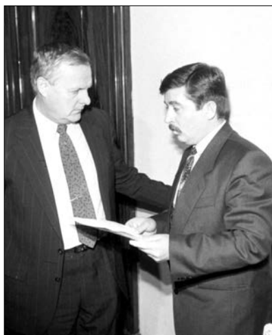
А.А. Собчак и С.М. Шахрай. Санкт-Петербург. 1 ноября 1993 года