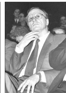
Государственный секретарь РФ Г.Э. Бурбулис