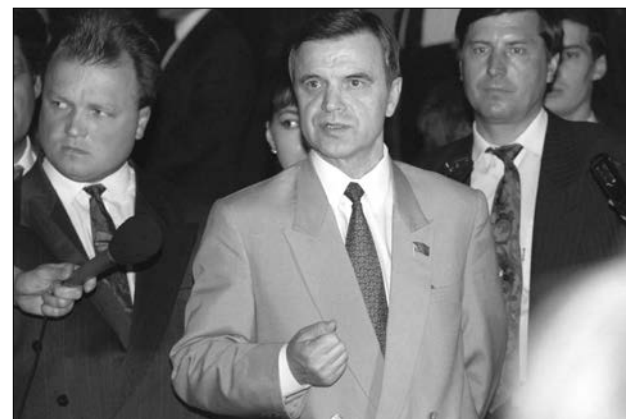
Р.И. Хасбулатов на первом пленарном заседании Конституционного совещания в Кремле. Москва, 5 июня 1993 года