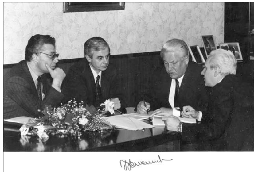
Подписание проекта Конституции Российской Федерации в печать и на всенародное голосование. Москва, Кремль. Кабинет Президента РФ. 8 ноября 1993 года. Слева направо: Ю.М. Батурин, В.В. Илюшин, Б.Н. Ельцин, С.А. Филатов