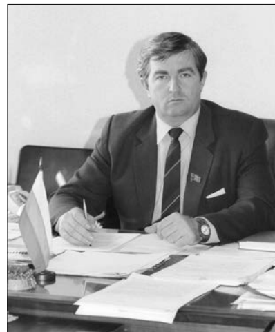
Народный депутат РФ, начальник Главного правового управления Президента РФ А.А. Котенков. 1 июля 1992 года