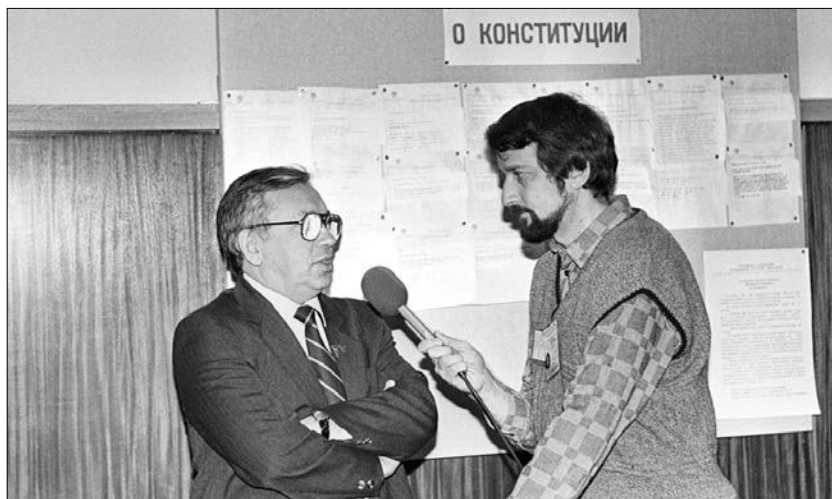
Член Конституционной комиссии, председатель Комитета Верховного Совета РФ по международным делам В.П. Лукин даёт интервью в фойе Большого Кремлёвского Дворца у стенда с телеграммами избирателей о проекте Конституции