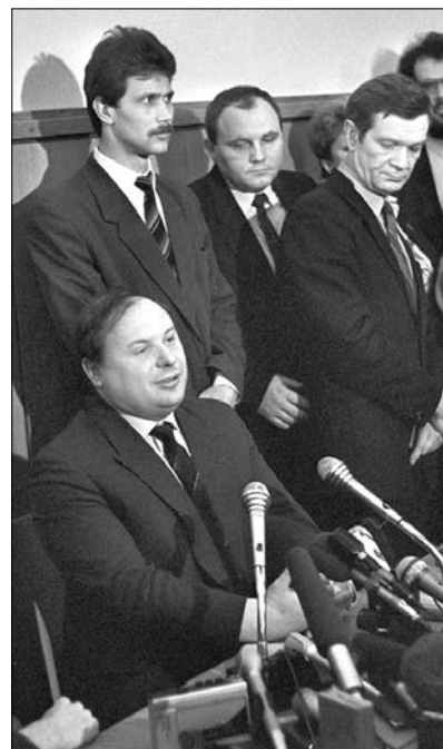
И.о. Председателя Правительства Е.Т. Гайдар на пресс-конференции