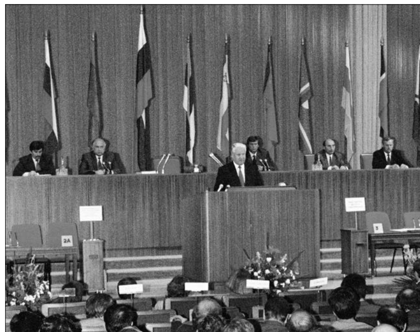
Президент РФ Б.Н. Ельцин во время выступления на заседании Конституционного совещания. Москва, Кремль. 12 июля 1993 года. В президиуме (слева направо): С.М. Шахрай, В.С. Черномырдин, В.Ф. Шумейко, Ю.Ф. Яров, А.А. Собчак