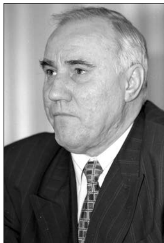
Заместитель начальника ГПУ Президента РФ А.Я. Слива