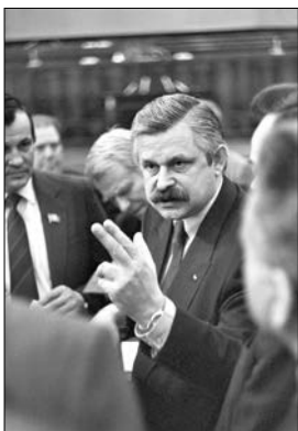
Вице-президент РФ А.В. Руцкой с народными депутатами РФ. 1992 год