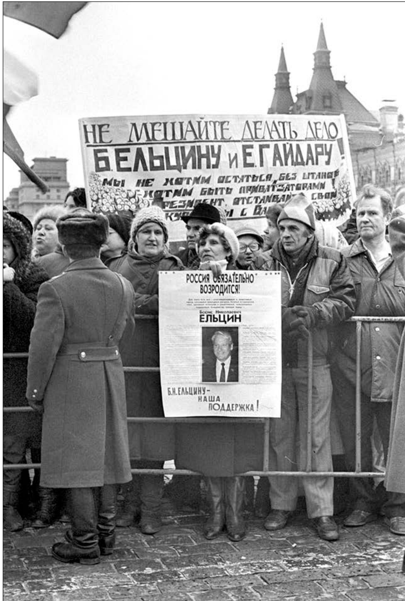
Избиратели: Вера, Надежда, Поддержка. 1992 год