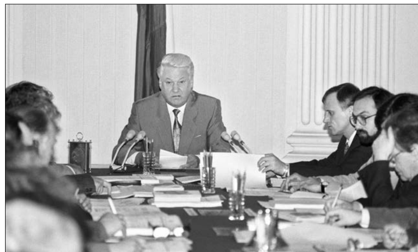
Пленарное заседание Конституционной комиссии РФ. Кремль, Овальный зал. 29 июля 1992 года. Слева направо: Б.Н. Ельцин, Г.Э. Бурбулис, О.Г. Румянцев, С.А. Ковалёв