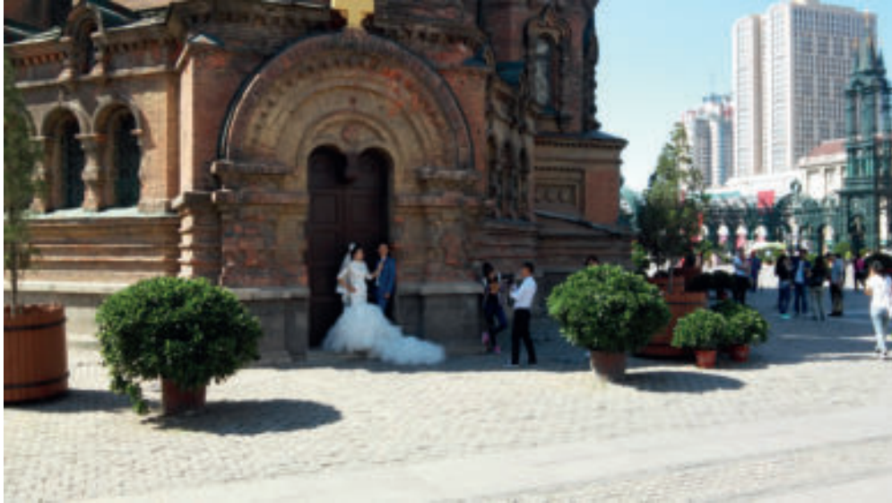
Рис. 9. Софийский собор г. Харбине, 2015 г.