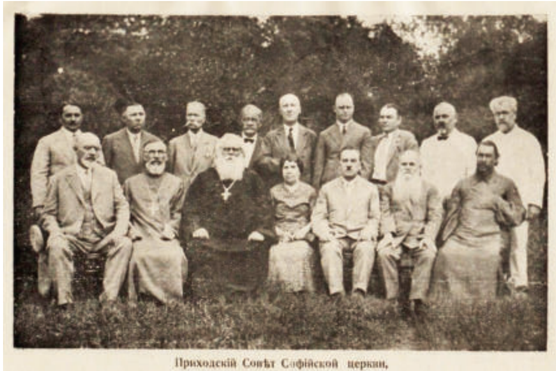
Рис. 1. Приходский Совет Софийской церкви [17, с. 10а]