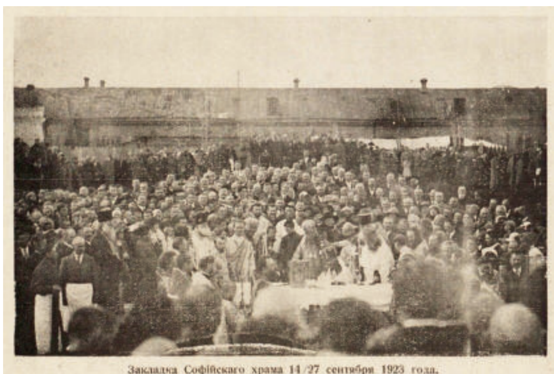
Рис. 5. Закладка Софийского храма 14/27 сентября 1923 года.