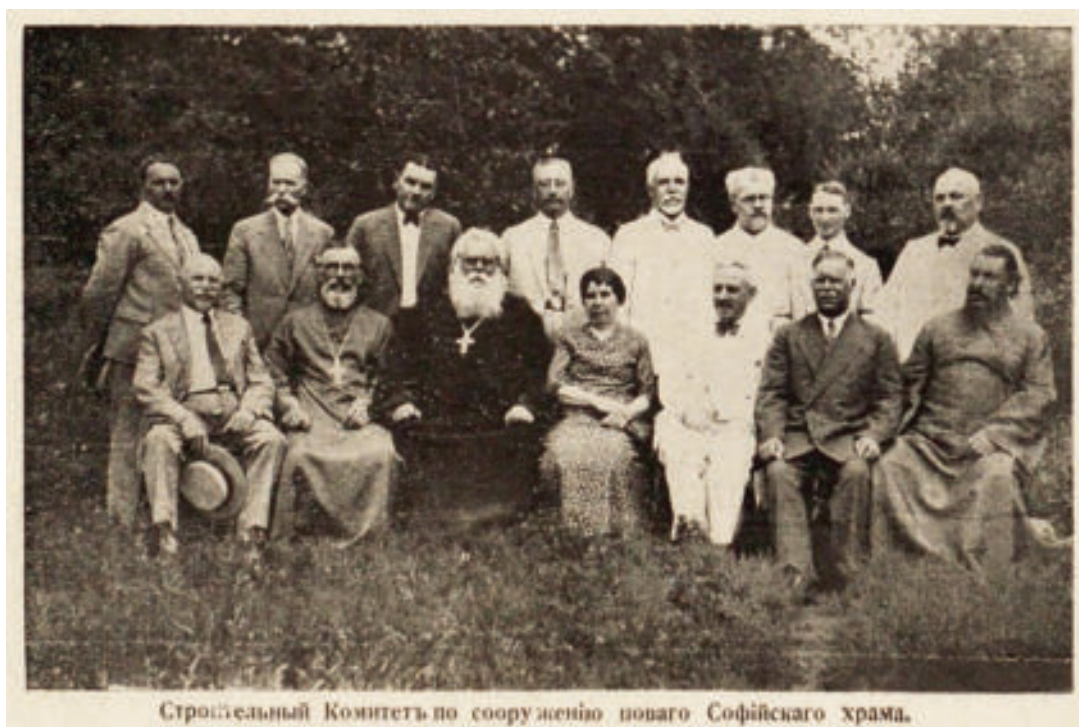
Рис. 4. Строительный комитет по сооружению Софийского храма [17, с. 6а]

В сентябре 1923 г., в День Воздвиженья Честного и Животворящего Креста Господня, после литургии с крестным ходом Архиепископом Харбинским и Маньчжурским Мефодием, епископом Забайкальским и Нерченским Мелетием, епископом Камчатским и Петропавловским Нестором проведена закладка храма (рис. 5) [17, с. 5, 6].