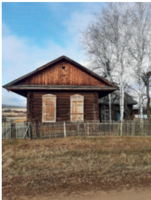
Рис. 1. Иннокентьевская церковь с. Залог Качугского района

Церковь была построена проживавшим в с. Залог богатым верхоленским купцом М. А. Сапожниковым, причем иконостас храма был написан лучшими мастерами Иркутска, церковная утварь и ризница были выпишаны из Москвы, а колокола – с Ирбитской ярмарки. «В 1930-е годы церковь закрыли, и в здании устроили пункт Заготзерна. В дальнейшем ее разобрали и перевезли на другое место в центре села и поставили в ряду жилых крестьянских усадеб, устроив здесь школу. При переносе утрачены были не только купола, но и вся верхняя часть здания» [1, с. 243].