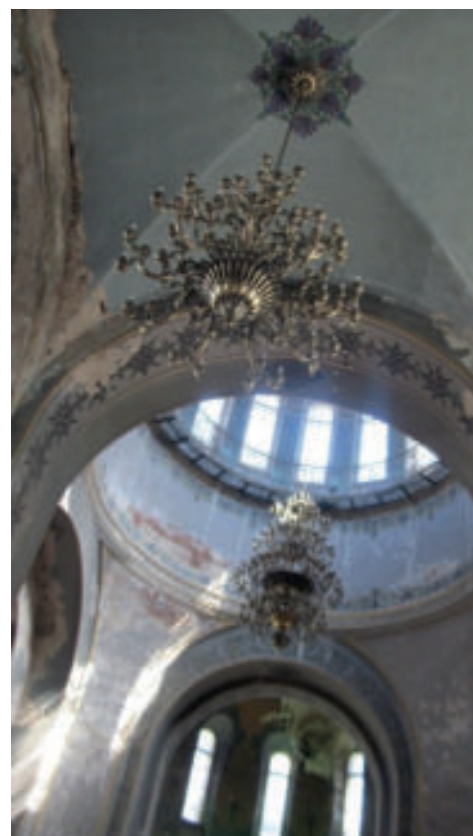
Рис. 8. Внутреннее убранство Софийского собора г. Харбине, 2015 г.