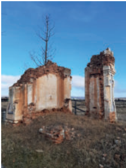
Рис. 4. Семейное кладбище с руинами часовни

В прошлом году проведена историко-культурная экспертиза Иннокентьевской церкви, экспертом дано заключение о внесении выявленного памятника в реестр памятников истории и культуры. Дом Сапожникова и семейное кладбище с руинами часовни проходят экспертизу в текущем 2023 г. Очевидно, что кладбище с часовней должны быть признаны достопримечательным местом.