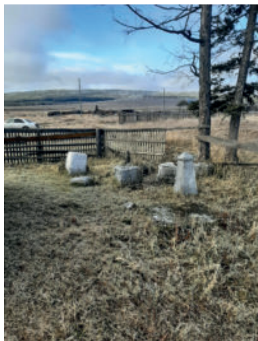
Рис. 3. Семейное кладбище