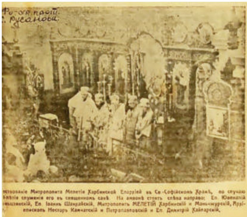
Рис. 6. Чествование Митрополита Мелетия Харбинской Епархии в Св. Софийском храме [8].

С ноября 1996 г. находится в списке памятников культуры Китайской Народной Республики [15]. Сегодня Софийский собор украшает современный Харбин своим особым обликом и является одной из достопримечательностей города (рис. 9).