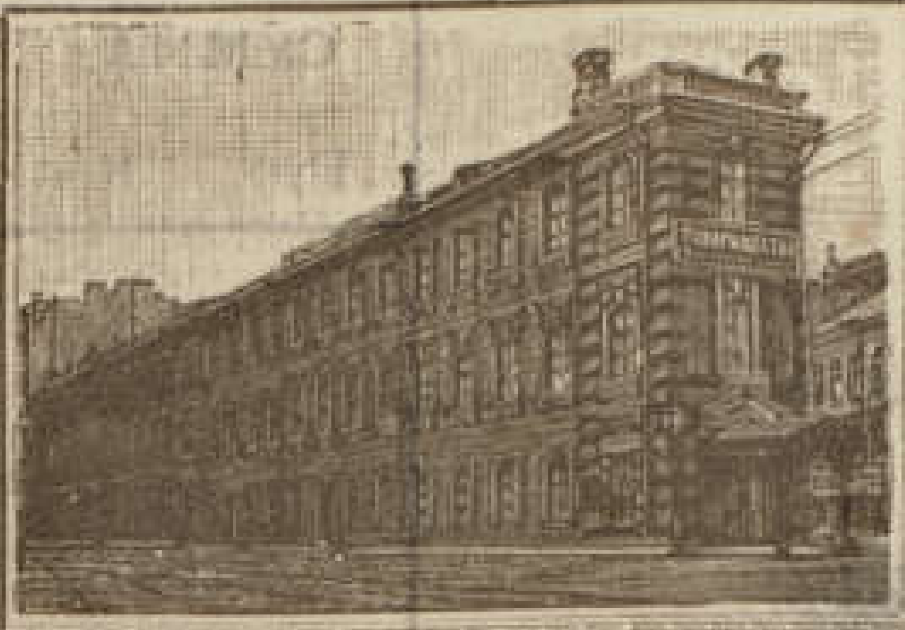
С.-Петербургъ, Б. Подъяч. соб. д. 39.