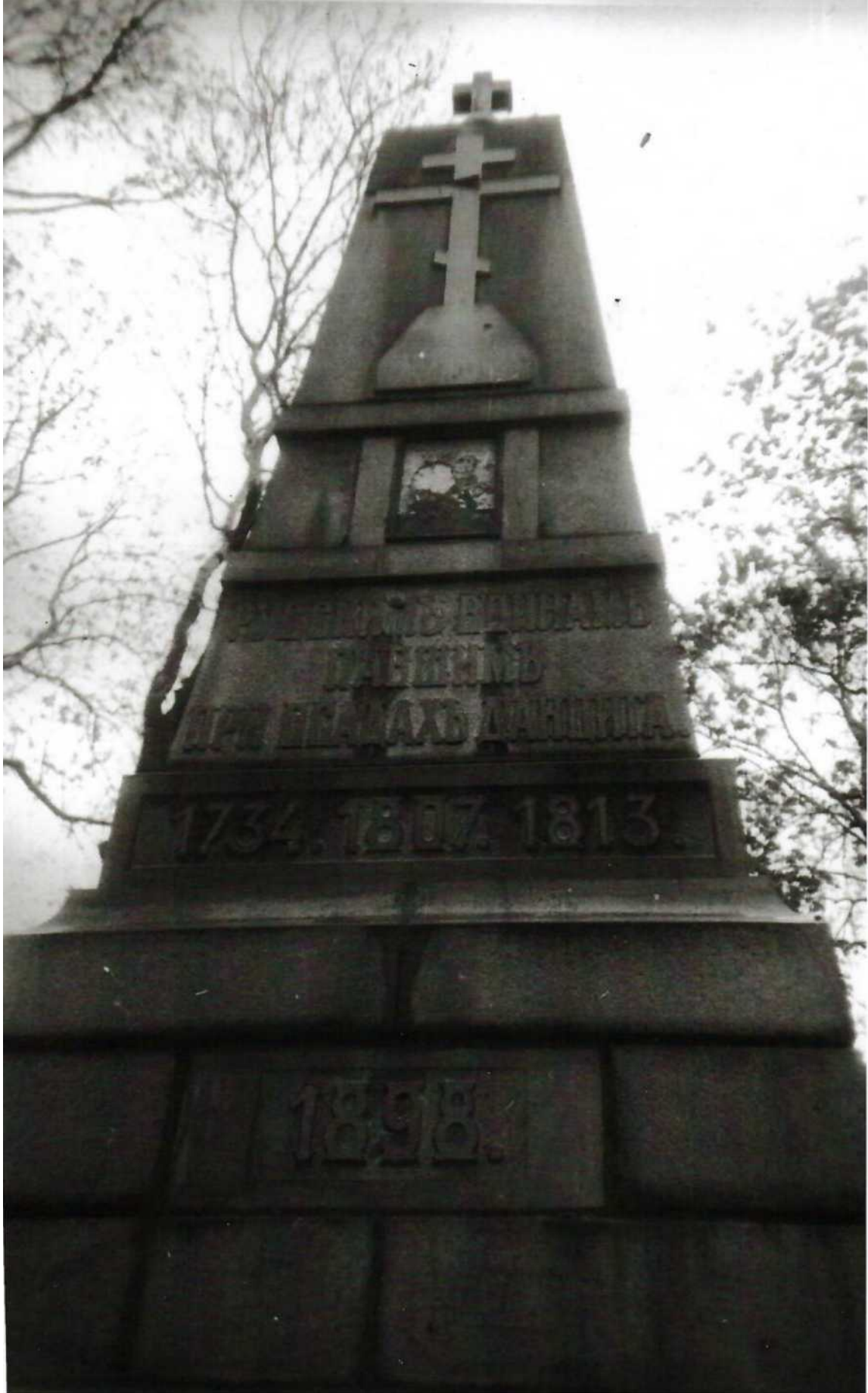
Польша, г. Гданьск (Данциг). Фрагмент памятника на русском кладбище.