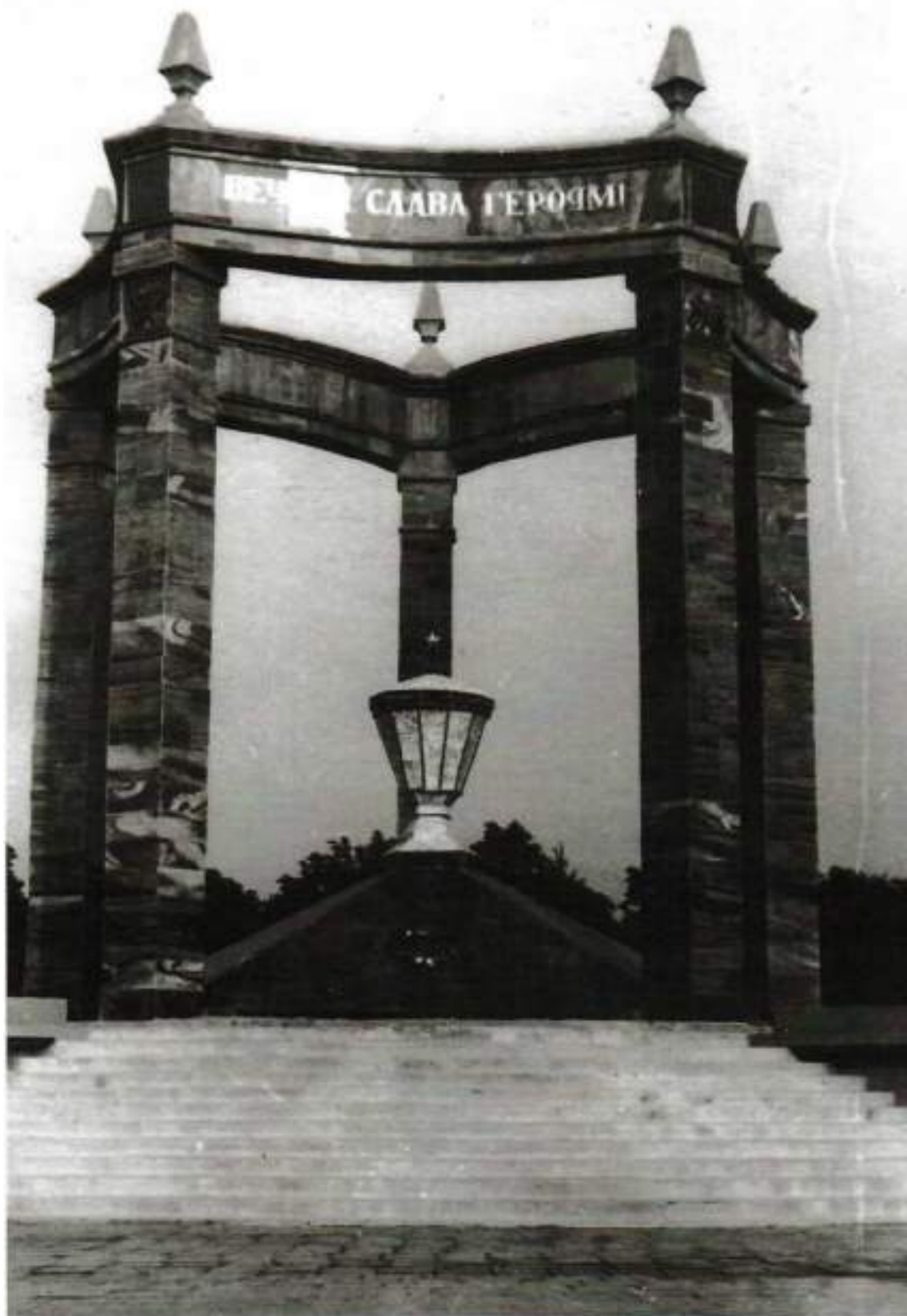
Польша, г. Бреслау, 1945 г. Памятник бойцам и офицерам Красной Армии, погибшим за г. Бреслау. На кладбище в г. Бреслау.