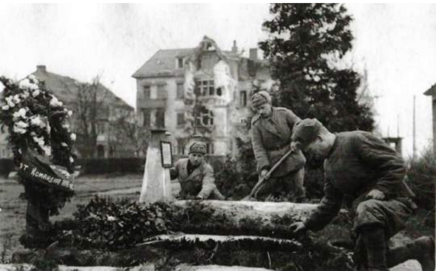
Польша, г. Бреслау, 1945 г. Похороны товарищей, погибших в боях за г. Бреслау.