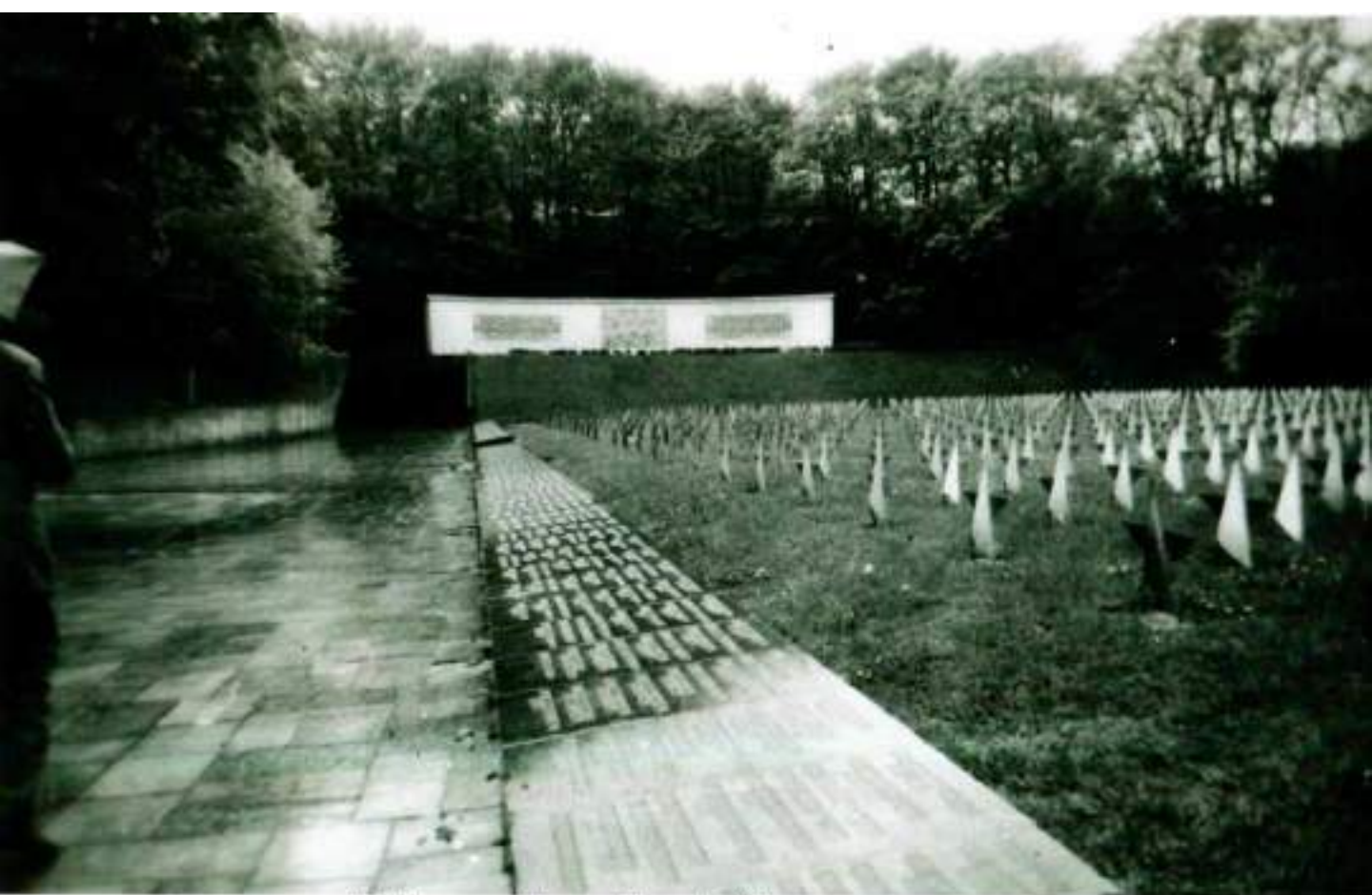
12. Польша, г. Гданьск (Данциг), 1991 г., кладбище советских воинов.