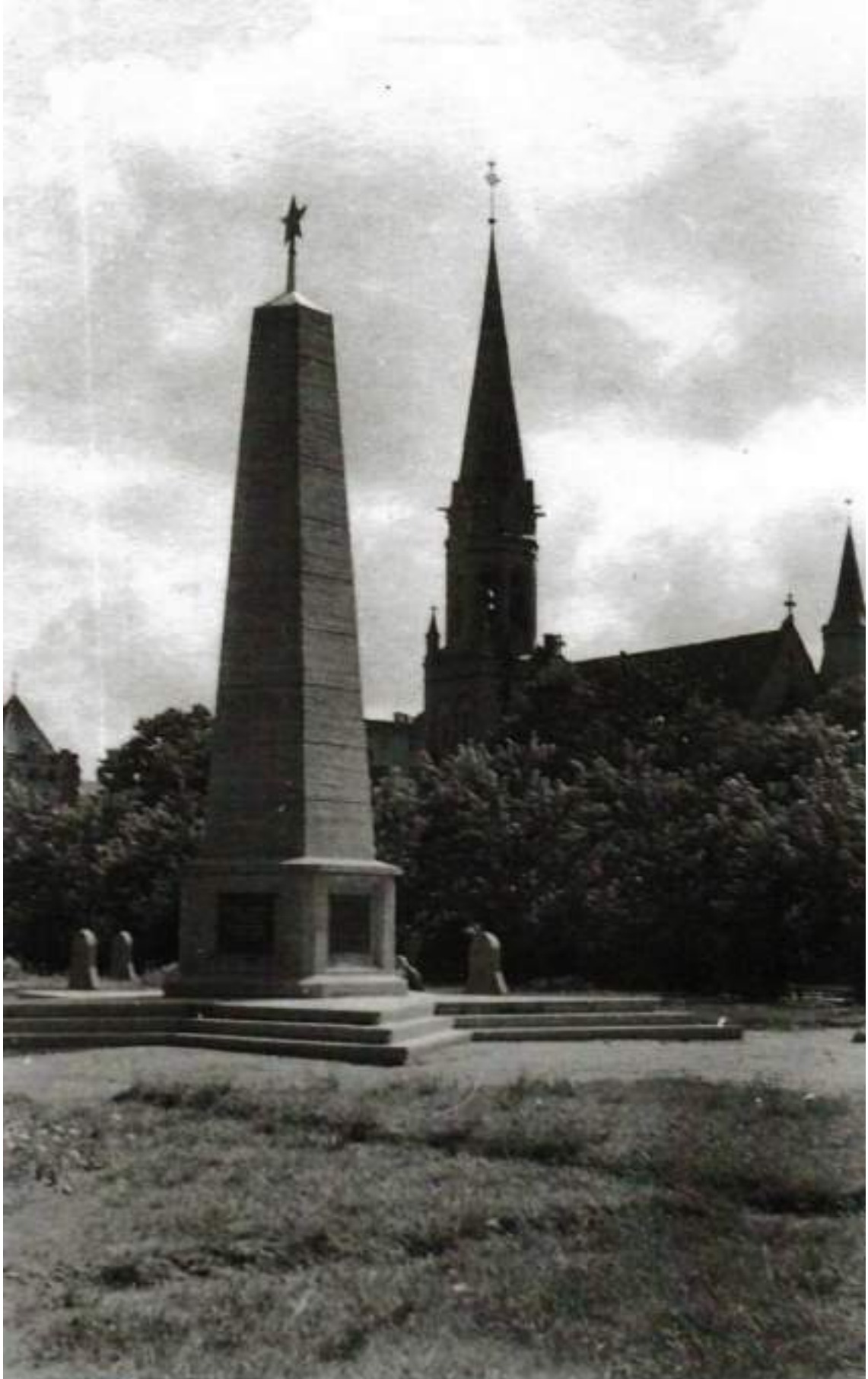
Польша, г. Торунь, 25 сентября 1946 г. Вид памятника советским бойцам и офицерам на Театральной площади.