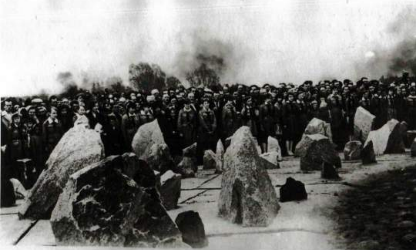
Польша, 1964 г. Участники церемонии открытия памятника умерщвленным в газовых камерах концентрационного лагеря в Трешлинке.