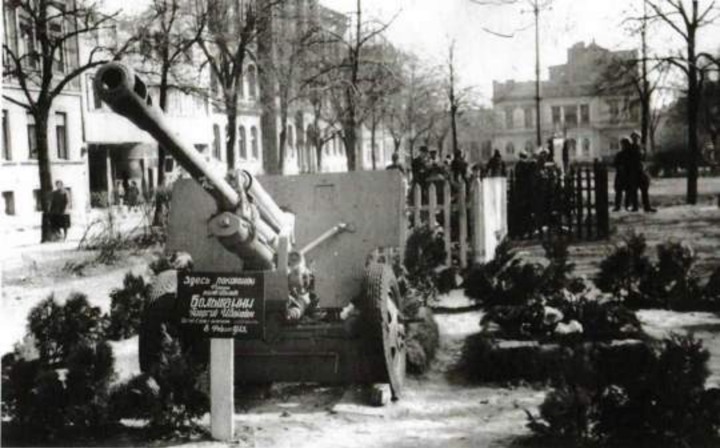
Польша, 1944 г. Памятник герою-артиллеристу, полковнику Большанину.