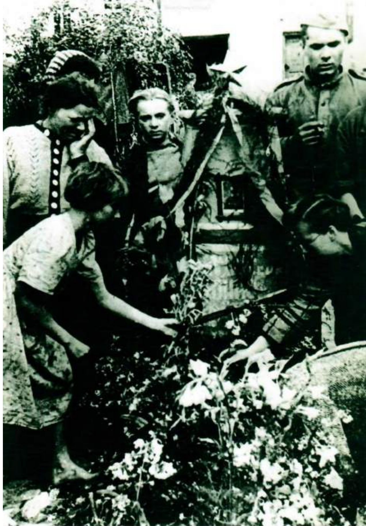
Польша, 1944 г. Жители села, освобожденного от немецко-фашистских захватчиков, возлагают цветы на могилу советского офицера.