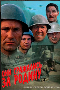
Они сражались за Родину