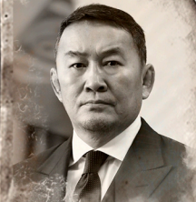
Халтмаагийн Баттулга ПРЕЗИДЕНТ МОНГОЛИИ, ИНИЦИАТОР ПРОЕКТА