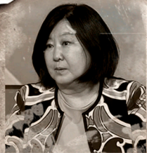
Банзрагч Дэлгэрмаа Посол Монголии в России, КООРДИНАТОР ПРОЕКТА