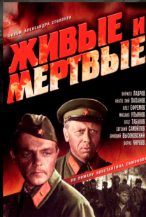
Живые и Мертвые