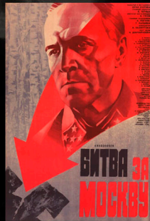
Битва за Москву