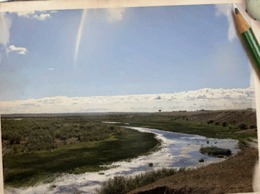
Монголия. Река «Халхин-Гол»